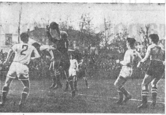
В Барнауле состоялась товарищеская встреча по футболу между армейцами Новосибирска и местными динамовцами. Она закончилась со счетом 1:0 в пользу гостей. На снимке: момент игры.