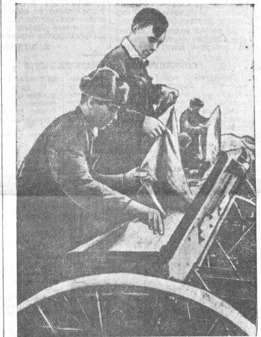
Короткая остановка, и сеялки загружены семенами. Можно продолжать сев.

Или вот еще что. Сейчас, замеряя участок, учетчик берет ширину и длину загонок только с одной стороны поля. Это не