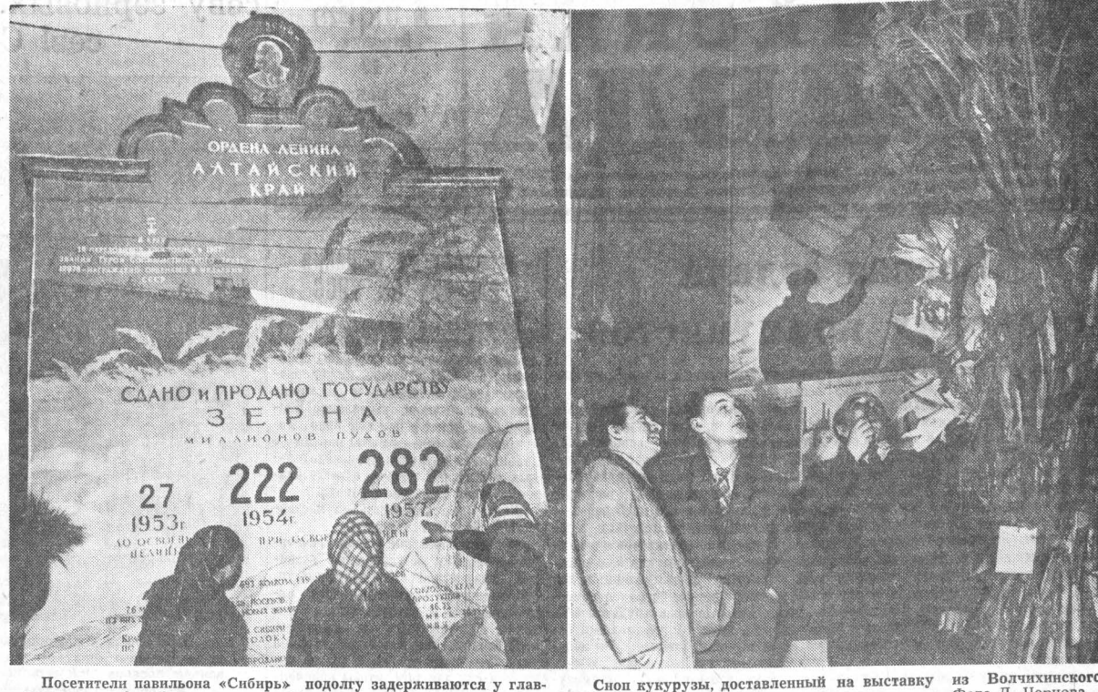
Посетители павильона «Сибирь» подолгу задерживаются у главного стенда Алтайского края.