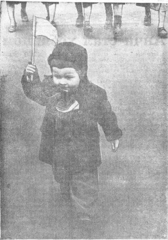
Алые колышутся знамена, Заслоня дуге неба синь. И шагает впереди колонны Маленький серьезный гражданин.