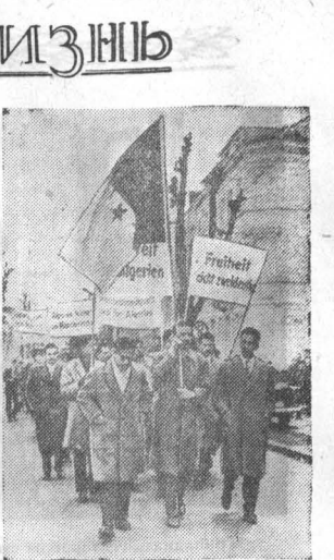
Федеративная Республика Германии. Недавно Совет арабских студентов Боннского университета организовал демонстрацию протеста против прощальной французским правительством в Алжире колониальной войны. Обучающиеся в Бонне студенты из стран Африки и Азии продемонстрировали солидарность с алжирским народом, ведущим борьбу за свободу и независимость. На снимке: демонстранты на улицах Бонна. Они несут транспаранты: «Свободу Алжиру», «Самостоятельные также для Алжира», «Положить конец истребительной войне в Алжире».

разом, пишет газета, официально подтверждается, что Западный Берлин, как выдвинутой вперед позиции, включен в план атомного вооружения НАТО и все заявления западноберлинского бургомистра В. Брандта, утверждавшего противоположное, противоречат действительности.