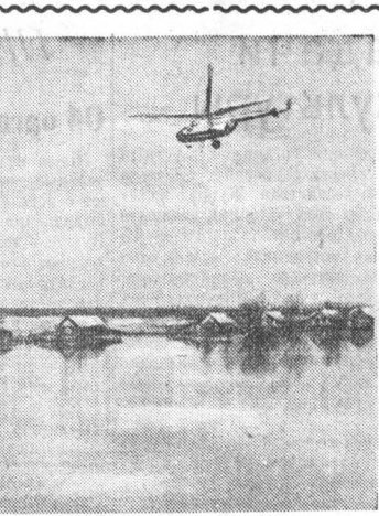
Фото и текст Э. Гордона, г. Бийск.

обстановку на реках края. Давно не было на Алтае такой обильной на снеготопы зимы, и вот теперь реки переполнились весенними водами. Уровень Оби повышается с каждым днем.