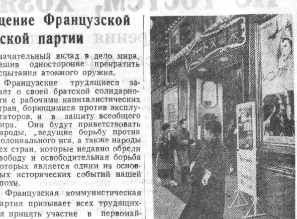
Япония. В токийском кинотеатре «Токио-генкидзэ» демонстрируется советская кинокартина «Ленинградская симфония».