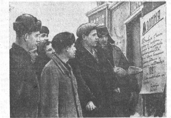
Редакция стеной газеты цеха крупного железобетонного комбината производственных предприятий треста «Стройгаз» выпускает листовку «Молния». На снимке: рабочие читают свежий номер «Молнии».

Районное совещание рабселькоров и редакторов стеной газет прошло под знаком усиления рабселькорского движения, улучшения идейного содержания местной печати.