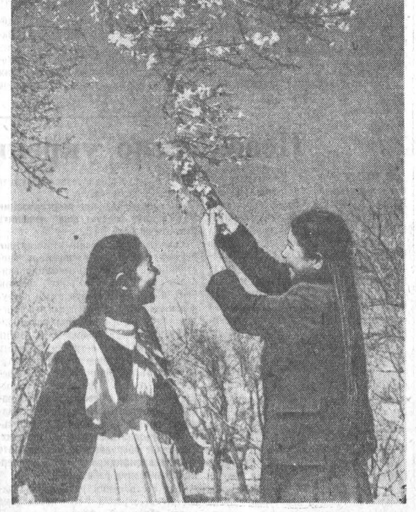
Цветут сады в Бухаре...

СЕМИПАЛАТИНСК, 17 марта. (ТАСС). В 25 километрах выше Семипалатинска Иртыш преодолел каменную преграду — она разрушена продвижением судов. Для спрямления и углубления русла речники построили дамбу протяженностью 250 метров и высотой полтора метра. Все протоки в районе переката теперь перекрываются нагулоу. На главном русле реки созданы нормальные условия для прохода всех типов речных судов.