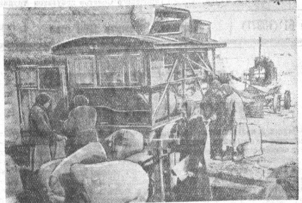
Делом отвечают труженники колхоза «Искра» Топчихинского района на постановление февральского Пленума ЦК КПСС. В колхозных бригадах быстрыми темпами завершается подготовка семян к севу.

Совещание единодушно одобрило постановление февральского Пленума ЦК КПСС и приняло его к неуклонному исполнению.