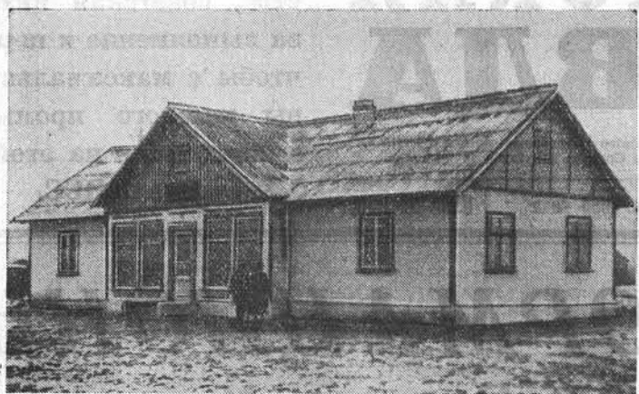
На снимке: новый магазин, построенный силами механизаторов Мамонтовской МТС.

Пленум ЦК КПСС выражает уверенность, что рабочий класс, колхозное крестьянство, советская интеллигенция еще шире развернут социалистическое соревнование за выполнение и перевыполнение производственных планов, приложат все силы к тому, чтобы с максимальной полнотой использовать производственные возможности и резервы каждого промышленного предприятия, каждой стройки, всех колхозов, МТС и совхозов, и на этой основе добиться успешного осуществления исторических решений XX съезда КПСС.