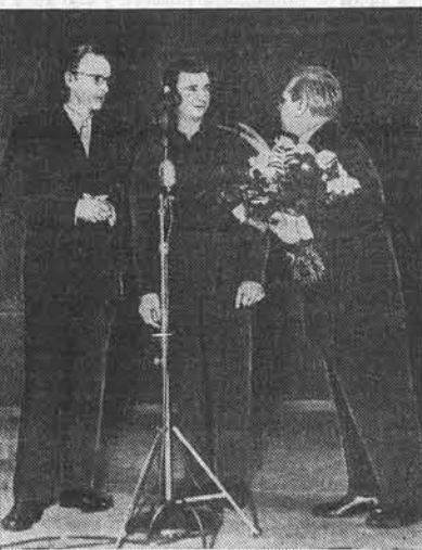
Москва. В концертном зале имени П. И. Чайковского состоялся концерт популярной французской певицы Ива Монтана. На снимке: народный артист СССР С. Образов приветствует Иву Монтана.