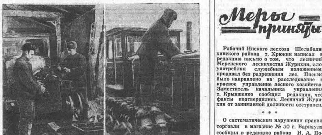
руководит совхозом т. Снежкин, но даже временной мастерской в хозяйстве не выстроено. Подумать, почему ремонт тракторов в совхозе затянулся.

Уже третий год Родниковое строуправление треста «Алтайсовхозстрой» воздвигает ремонтные мастерские в целинном совхозе. Но и поныне на окраине поселка виднеются неоконченные стены, словно памятник горе-строителям. Уже три года