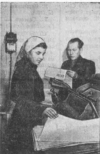
Новоселы Романовского зерносовхоза проявляют большой интерес к периодическим изданиям. В 1957 году они будут получать 186 экземпляров центральных и местных газет и 128 различных журналов.