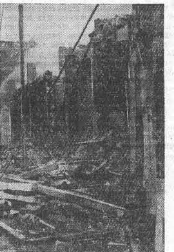
Англо-франко-израильская агрессия в Египте. Порт-Саид. Ноябрь 1956 г. Жилые дома, разрушенные агрессорами.

ТЕЛЬ-АВИВ, 8 декабря. (ТАСС). Как явствует из сообщения военного корреспондента израильской газеты «Амарех», плохое состояние дорог, по которым продвигаются войска ООН вслед за израильскими войсками, начавшими отход с египетской территории, является