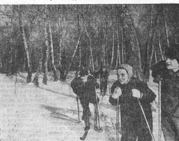
Сегодня в Барнауле традиционными лыжными эстафетами на приз „Алтайской правды“ откроется зимний спортивный сезон. В 11.30 дня на лыжной базе спортобщества „Трудовые резервы“ состоится парад лучших физкультурников краевого центра. В 12 часов будет дан старт. Упорной будет борьба лыжников. Почетные призы нынче будут оспаривать около 120 команд. Трудно сейчас предугадать победителей. Но мы, конечно, будем те, кто отлично подготовился к состязанию, много и упорно тренировался. На снимке: лыжники „Красного знамени“ на тренировке.