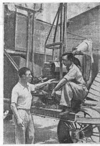
В Индии получен дар Советского правительства — оборудование для сельскохозяйственной фермы: самоходные комбайны, тракторы, грузовые и легковые машины, бензопилы. Для помощи в сборе сельскохозяйственных машин в Индию была послана группа советских специалистов.

105 ТЕЛЕФОНЫ: справля (круглые сутра) 3-46 в 14-03, редактор 14-03, зам редактора 15-48, отв. отв. секретаря 18-12, отв. отв. секретаря 4-54, ОТДЕЛЫ: партийный отдел и прокатная 4-71, промышленно-транспортный отдел 13 в городской 17-78, упр. издательством 18-71, прием