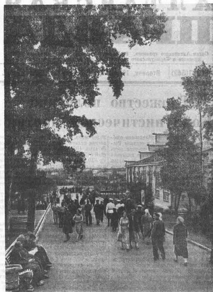
В выходной день на краевой сельскохозяйственной выставке.