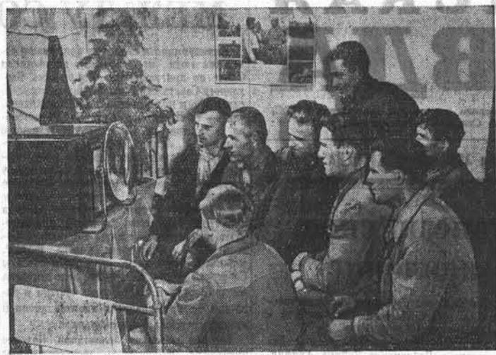
Украинская ССР. Харьковская МТС по всем показателям сельскохозяйственных работ в течение многих лет занимает первое место в области и является участником Всесоюзной сельскохозяйственной выставки. Механизаторы здесь окружены большой заботой и вниманием. Для тракторных бригад хорошо оборудованы полевые станы. В комнате отдыха установлены радиоприемник и телевизор. Сюда регулярно доставляются свежие газеты и журналы. В столовой стана готовятся вкусные и разнообразные блюда. Трактористам и комбайнерам, работающим на отдаленных участках, горячая пища доставляется в агрегатах. На снимке: механизаторы дневной смены после работы смотрят телевизор в полевом стане тракторной бригады № 4.

Некоторые руководители районных и краевых организаций в последнее время часто ссылаются на ненастную погоду. Но ведь на Алтае не впервые убирают хлеб в