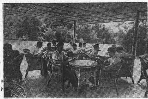
Румынская Народная Республика. Бухарест. На террасе библиотеки в Центральном парке культуры и отдыха в Бухаресте.

Жители местечка Сунавава (близ Токио) при поддержке профсоюзов оказали в конце прошлого года решительное сопротивление планам расширения американской базы в этом районе. В результате этой борьбы проведение топографических работ было отложено на более поздний срок.