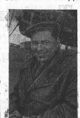
Восточная Арктика, 18 августа семнадцатый чукчей-охотников на четырех байдарках вышли на промысел морского зверя. Неожиданно поднялся шторм. Охотники оторвали от берега и унеслись в море. Прошло пять дней — охотники не возвращались, и судьба их была неизвестна. Начальник Провиденского районного управления Гласевморпуть П. П. Грузинский приказал летчику поларной авиации, командиру самолета «СССР Н-529» Юрию Белокриницкому отправиться на розыски охотников.

— Был сильный туман, когда мы вылетели с мыса Шмидта, — рассказывает летчик. — От мыса Джингретел мы тщательно исследовали все побережье и в 10 километрах от чукотского поселка Тойгунки заметили охотников. Чтобы укрыться от ветра, они поставили свои байдары ребром и под защитой ветров в центре льдина разбили палатку. Мы сбросили им выпел и в записке просили указать, в чем они нуждаются. Охотники знаками сообщили, что у них иссякли продукты. Мы снились до бреющего полета и сбросили им весь имеющийся на борту запас продуктов. На следующий день мы вновь посетили охотников и вновь снабдили их продуктами. Вскоре шторм утих, и охотники благополучно добрались на байдарках до своего поселка.