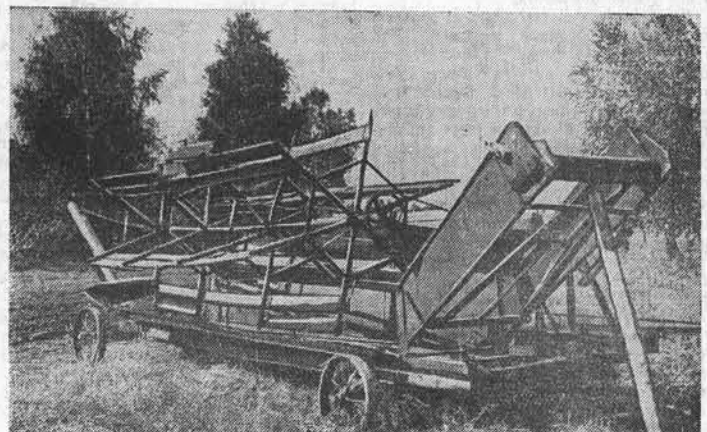
На снимке: одна из 20 бездействующих лафетных жаток Тальменского МТС в первой бригаде колхоза «Балтеца».