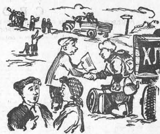
— Куда это товарищ провозалят, в Антарктиду что-ли? — Да нет, на элеватор, это немного ближе.

В колхозе имени Фурманова Чарышского района на токах скопилось много зерна. На глубинку его не сдают, а возят на элеватор за 120 километров. В результате хлебодача идет крайне низкими темпами.