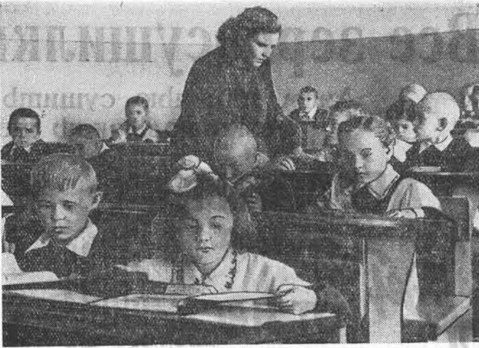
Фото и текст И. Фоменко.

Производительность цеха рассчитана на 4.000 условных банок в сутки. Первая партия консервированных овощей поступила в продажу. Уже в нынешнем году цех законсервирует более 100 тонн свежих огурцов, помидоров и баклажанов.