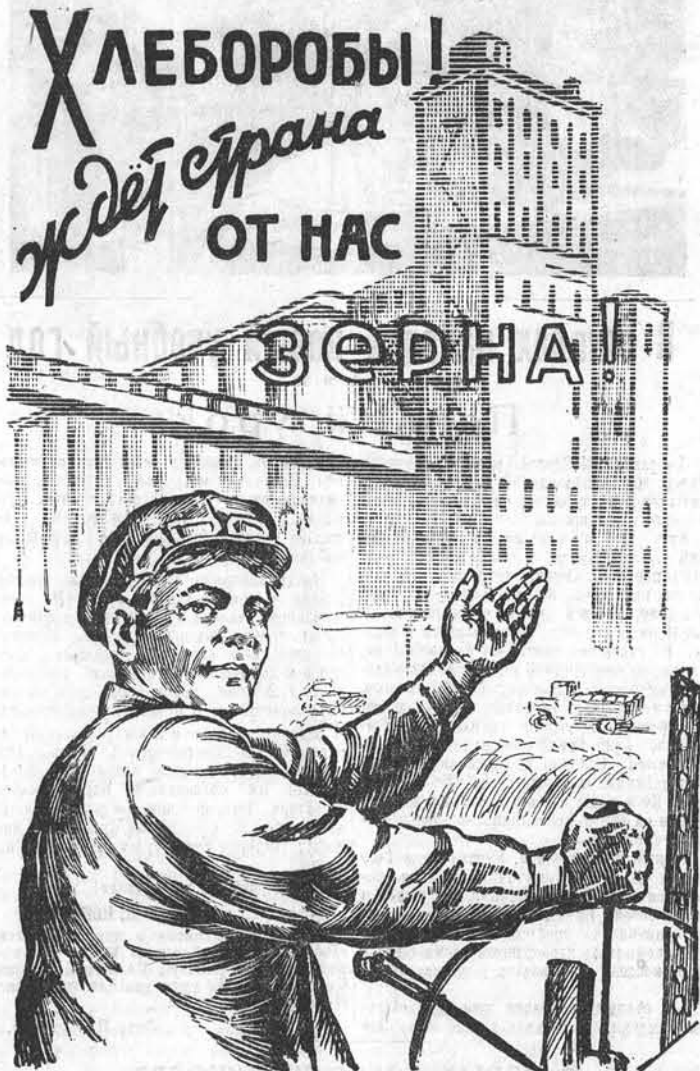
Плакат худ. С. Савчука.

Днем и ночью сушить и подрабатывать зерно, резко повысить темпы хлебозаготовок!