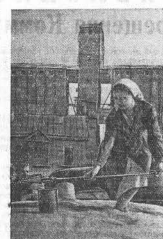
На Михайловском пункте Заготзерно сдана в эксплуатацию вторая очередь элеватора, сушильно-очистительная башня с зерносушилкой «ДСП-24». Заваначается строительство второй такой же зерносушилки. В этом году на пункте одновременно можно разгрузить 30 автомашин. Сейчас пункт готов принимать до пяти тысяч тонн зерна в сутки.

Е. ВАНСМАН, редактор заводской многотиражной газеты «Вагонник», г. Барнаул, вагоноремонтный завод.