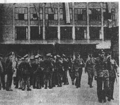
После вынесения решения судебных властей в Западной Германии с запрещении Коммунистической партии в стране начался разгул полицейского террора. В городах Рурской области, в Гамбурге и Дюссельдорфе полицейские проводили обыски в рабочих кварталах и нападками на редакции газет и служебные здания КПГ. Многие члены компартии подверглись аресту. По всей Германии началось мощное народное движение протеста против террористических мероприятий боннских властей. На снимке: нападение полицейских на здание КПГ в Дюссельдорфе. В знак протеста коммунисты вывесили на окнах здания национальные флаги.

Заявление премьер-министра ФАГЕРХОЛЬМА СССР К. Е. Ворошилова. Он сказал, что этот визит является доказательством хороших отношений между соседями и того уважения, которое питают в Советском Союзе к народу Финляндии.