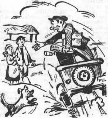
Рис. А. Уропина.

В чем секреты производственных успехов передовых механизаторов? ОРГАНИЗАЦИЯ ТРУДА И РАСПЯДОК РАБОЧЕГО ДНЯ Производительность уборочных машин в