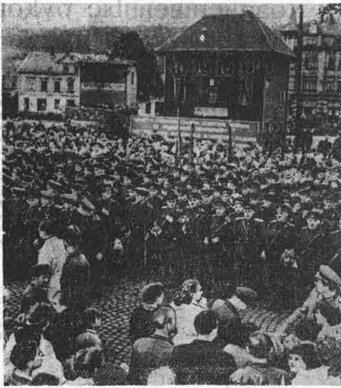
В ряде городов Германской Демократической Республики состоялась очередная отправка на родину расформированных частей группы советских войск в Германию. Солдат и офицеров расформированных частей повсюду провожали тысячи трудящихся, которые им выразили сердечные пожелания успехов в мирном труде. На снимке: население города Шварценберга провожает советские части.

Как сообщил официальный египетский представитель, ответ Мензису будет передан через посольство Египта в Лондоне.