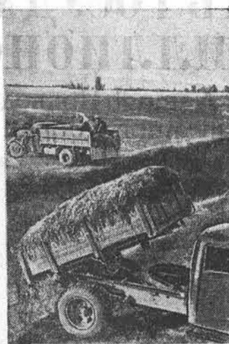
Колхозники сельхозартели имени Свердлова Ребринского района проявляют большую заботу о заготовке кормов для скота на зиму. Они уже заготовили 12.000 центнеров грубых кормов и заготовили 10.500 центнеров кукурузы. На снимке: заготовка кукурузной массы в траншеи.

Раздаются аплодисменты в честь Коммунистической партии Советского Союза.