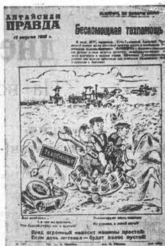
«Беспомощная техпомощь» — так называется эта листовка «Алтайской правды», выпущенная с сегодняшним номером газеты для сельских читателей.

Назначение Фредерика Жолио-Кюри. ПАРИЖ, 10 августа. (ТАСС). В «Журналь офисель» опубликован декрет о назначении известного французского ученого и видного общественного деятеля Фредерика Жолио-Кюри профессором кафедры радиоактивной и ядерной физики Парижского университета. Этот пост раньше занимала его покойная супруга Ирен Жолио-Кюри.