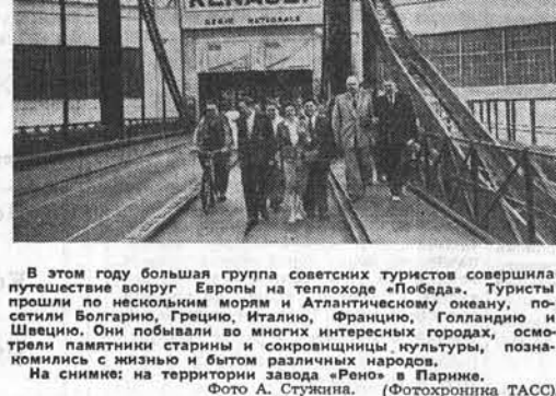
В этом году большая группа советских туристов совершила путешествие вокруг Европы на теплоходе «Победа». Туристы прошли по нескольким морям и Атлантическому океану, посетили Болгарию, Грецию, Италию, Францию, Голландию и Швецию. Они побывали во многих интересных городах, осмотрели памятники старины и современности, культуры, познакомились с жизнью и бытом различных народов. На снимке: на территории завода «Рено» в Париже.

Продолжая свои попытки оказать давление на Египет, газеты уделяют особое внимание назначенному на 12 августа совещанию в Велом доме лидеров обеих партий в конгрессе с президентом и государственным секретарем. Корреспондент газеты «Нью-Йорк геральд трибюн» Хингис в сообщении из Вашингтона, характеризует это совещание как «необычный шаг президента», заявляет, что оно «частично имеет целью подготовить конгресс к возможности того, что в случае, если положение ухудшится, правительство может потребовать предоставления ему права принять чрезвычайные военные меры».