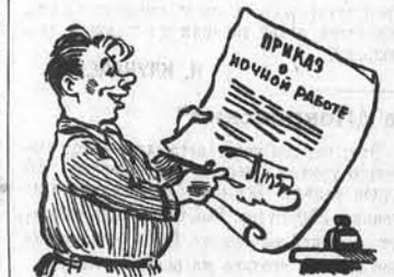
Приказ о ночной работе... и