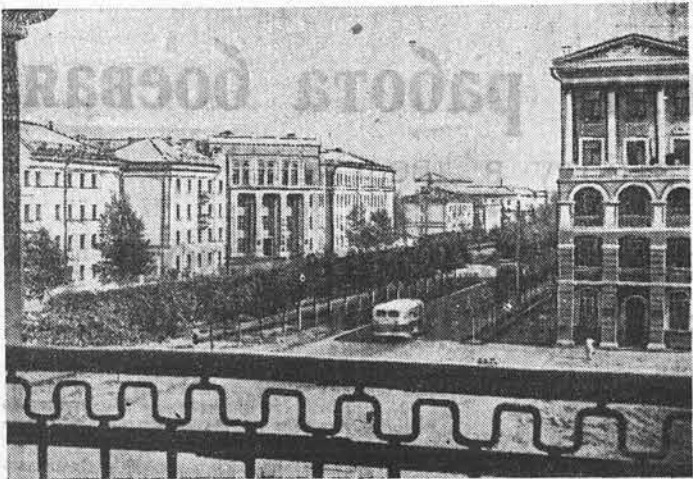
На Ленинском проспекте города Барнаула. Эти дома сооружежи строители за последние два-три года.