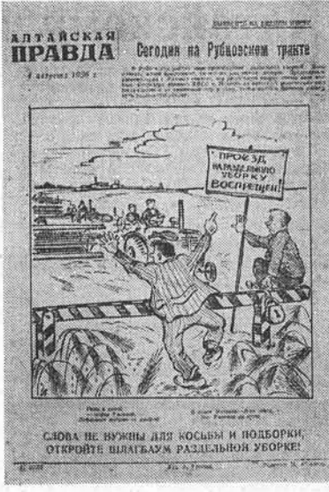
Эта сатирическая листовка «Алтайской правды» под заголовком «Сегодня на Рубинском тракте» раскрывается для сельских читателей с сегодняшним номером газеты.