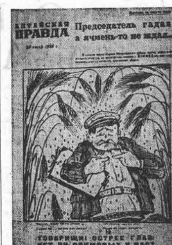
Эта сатирическая листовка «Алтайской правды» под заголовком «Председатель гадал, а дьяволь-то не ждал...» рассылается для села с сегодняшним номером газеты.

БЕИРУТ, 27 июля. (ТАСС). Как сообщает ливанский печатный орган, правительство начало принимать меры по проведению в жизнь закона о взимании налогов со всех иностранных компаний, которые до последнего времени пользовались налоговыми льготами по сравнению с национальными компаниями.