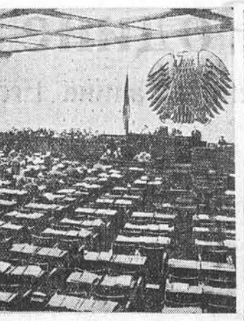
В Западной Германии вводится всеобщая воинская повинность. Против этого возражают многие депутаты бундестага. Во время обсуждения законопроекта депутаты — социал-демократы, свободные демократы и фракция общегерманского блока в знак протеста покинули зал заседаний. На снимке: в зале заседаний бундестага во время обсуждения законопроекта о введении всеобщей воинской повинности.

Проведение военных учений и введение в стране чрезвычайного положения в мирное время и, как здесь отмечают, как раз в годовщину совещания глав правительств четырех держав в Женеве вызывает возмущение ряда американских общественных организаций. По сообщению агентства Юнайтед Пресс, группа ладифистов решила не подчиняться закону о гражданской обороне и устроить во время учений противоздушную оборону демонстрацию, в которой должны принять участие члены католического рабочего движения, квакерского комитета друзей, братства ради примирения и лиги сопротивления войне.