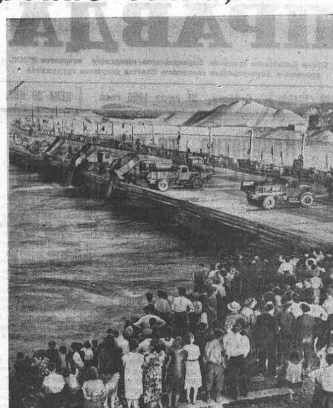
Иркутск. На площадке у подножия островков плотины Иркутской ГЭС выстроились автосамосвалы, бульдозеры, автокраны. В семь часов вечера по местному времени 8 июля началось отсыпка камня. К наплывному мосту с правого и левого берегов один за другим устремляются пятитонные самосвалы. Они обрушивают свой груз в реку. В воды Ангары сыплются тяжелые камни, бетонные кубы, гравий.

Вот как о ней пели сибиряки еще совсем недавно: «...У грозно-седого Байкала Красавица-дочь родилась. Рева, без конца и начала, Она Ангарой назвалась...» Рева была она и в самом деле. Старожилы и те боялись даже в тихую погоду перебраться на противоположный берег.