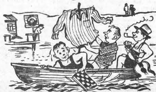
По воле волн...