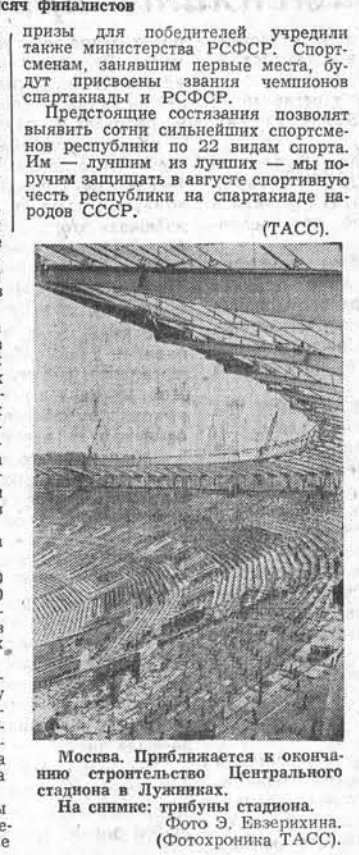
Москва. Приближается к окончанию строительство Центрального стадиона в Лужниках. На снимке: трибуны стадиона.

Восьмь тысяч финалистов. 8 июля в Москве на стадионе «Динамо» состоится большой спортивный праздник. Им откроется спартакиада народов РСФСР, в финальных соревнованиях которой примет участие восемь тысяч лучших спортсменов республики.