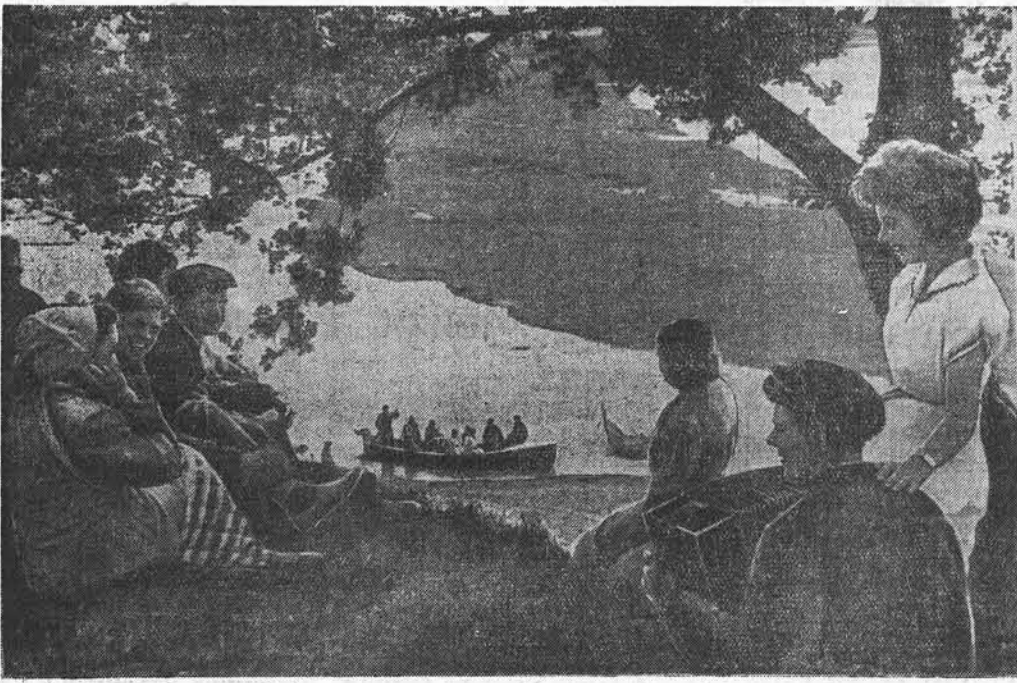
Выходной день в окрестностях Бийска.