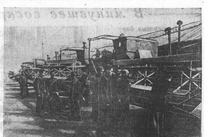
На снимке: курсанты Ключевского училища механизации сельского хозяйства № 20 на практических занятиях.