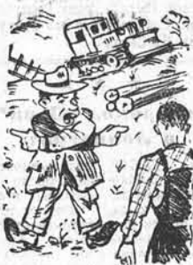
— Начальство распорядилось, чтобы вы селились вот там!

В. ВЕРДЫШЕВ, работник Тогульского детсада.