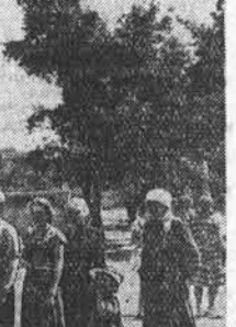
На снимке № 2 — очень частая картина у действующей сатураторной установки, которых в Барнауле совершенно недостаточно.