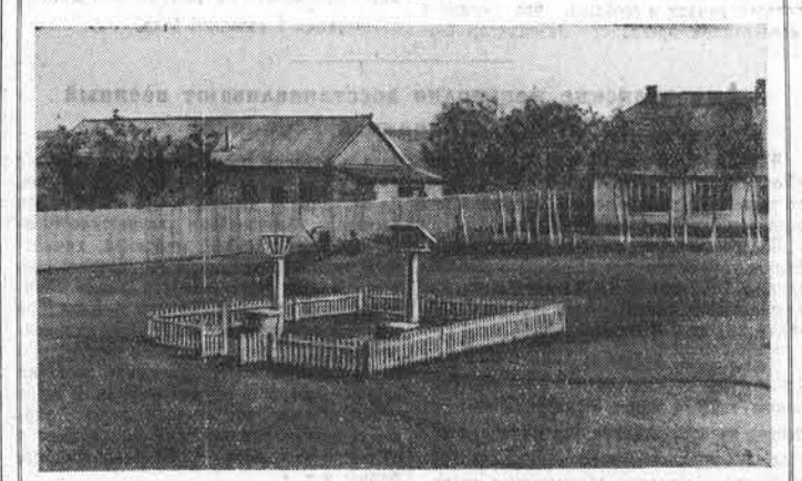
На снимке: агрометеорологический пост при Марушпинской МТС.

Наш край располагает широкой сетью предприятий местной и кооперативной промышленности. Промкомбинаты и артели выпускают ежегодно на сотни миллионов рублей товаров народного потребления. Тем не менее, в удовлетворении бытовых нужд населения у нас еще имеются очень серьезные недостатки.