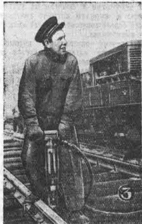
Фото и текст В. Николаева.

Так протрясутся в жизнь Дирекция XX съезда Коммунистической партии.