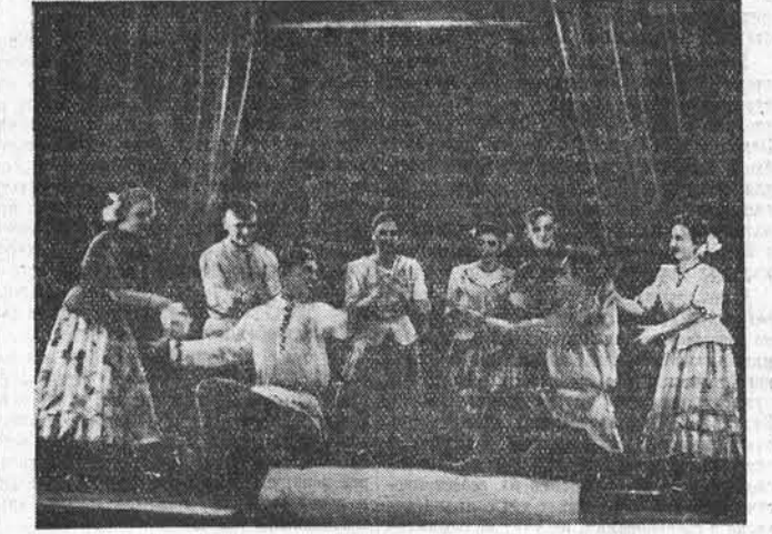
Первое место занял на смотре коллектив железнодорожного училища № 2 Барнаула. На снимке: будущие железнодорожники исполняют танец «Семеновна».