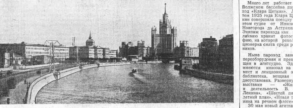
Москва сегодня. Вид на Москву — реку со стороны Москворецкого моста.

Московское туристско-экскурсионное управление открыло весенне-летний сезон. Начали работать десять баз. Они расширены, пополнены туристским снаряжением. В северо-западной части Калининской области, на озере Селигер введена новая очередь нового здания, рассчитанного на двести человек. Новый клуб сооружен на туристской базе в Звенигороде. Приняли первые группы любителей туризма базы «Бородино», «Лисинский бор» и другие. Вышли в первые рейсы пароходы «Н. Гастелло», «Л. Доватор» по маршруту Москва — Астрахань — Москва и «Алексей Толстой» по линии Москва — Уфа — Москва. В путешествие по Волге проведут отпуски сотни москвичей — рабочие, инженеры, учителя, студенты. Всего баз Московского туристско-экскурсионного управления обслужат за лето более ста тысяч человек.