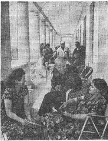
Крымская область. Недавно новый Ематорский санаторий имени XX съезда КПСС принял первую группу отдыхающих. Тепло встретил обслуживающий персонал здравницы трудящихся, приехавших из Москвы, Ростовской области, Донбасса.

Предложено обществу охотников (т. Бродикову) в районах поселка Кислухи, острова Татарского, села Харькова, поселка Рыбачьего, пристани Кукуй, сел Ракит и Барсукова оборудовать базы для рыболовцев, построить на базах помещения, иметь здесь лодки и различные рыболовецкие снасти.