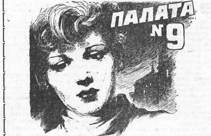
Сценарий — Т. Меран. Режиссер — Карой Манч. Фильм дублирован на киностудии им. М. Горького. Производство Венгерской киностудии. Выпуск 1956 года.

ТРЕБУЮТСЯ: ВАРНАУЛЬСКОМУ КОТЕЛЬНОМУ ЗАВОДУ срочно требуются слесари-механики, газорезчики, карусельщики, машинисты паровых молотов, машинисты-компрессорщики, составители, слесари, плотники, печники, штукатуры, маляры, столярщики, грузчики и рабочие.