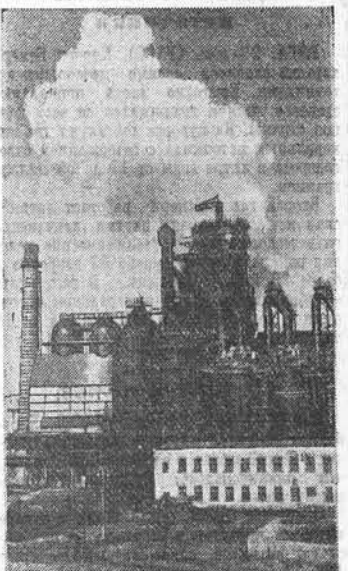
Вологодская область. Продолжается ввод в действие новых мощностей Череповецкого металлургического завода. Строятся и монтируются доменная печь, оборудованную по последнему слову техники. На снимке: новая доменная печь № 2.

Задача состоит в том, чтобы передовой опыт сделать достоянием всех рабочих. Следует сказать, что руководство завода, партийная и профсоюзная организации плохо занимаются распространением передового опыта. А ведь это одно из главных условий повышения производительности труда, успешного выполнения производственной программы.