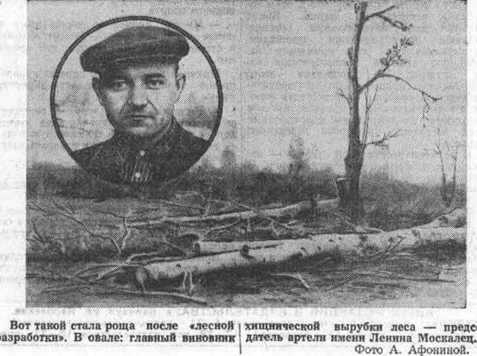
Вот такой стала роща после «лесной разработки». В овале: главный виновник хищнической вырубки леса — председатель артели имени Ленина Москалец.