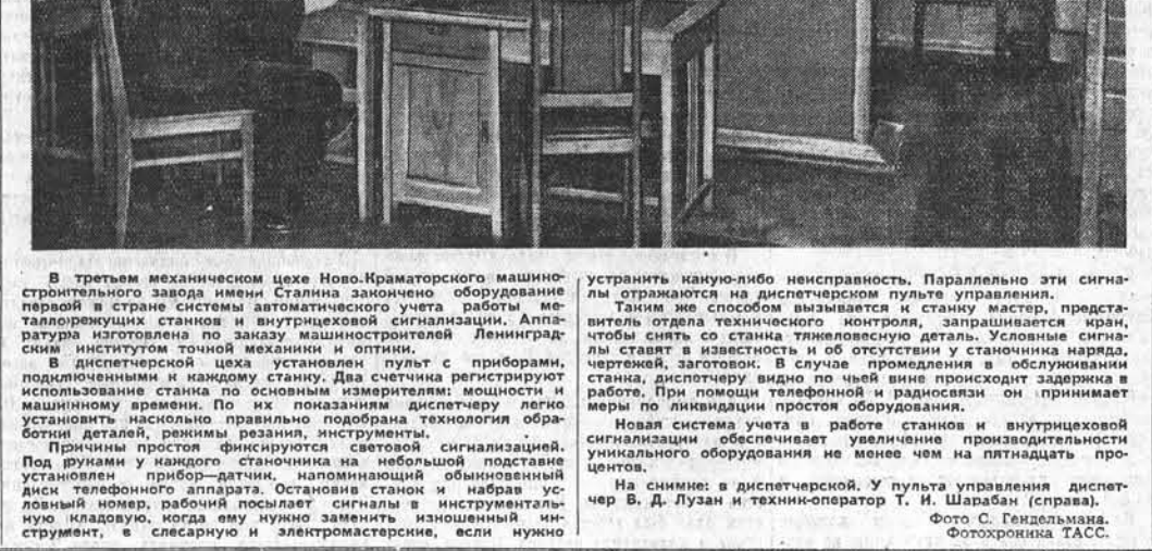
В третьем механическом цехе Ново-Краматорского машиностроительного завода имени Сталина закончено оборудование первой в стране системы автоматического учета работы металлургических станков и внутренней сигнализации. Аппаратура изготовлена по заказу машиностроительного Ленинградского института точной механики и оптики.