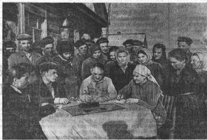
С огромным воодушевлением встретили колхозники сельхозартели имени Молотова Поселихинского района выпуск Государственного займа развития народного хозяйства СССР (выпуск 1956 года). Подписка прошла в обстановке большой политической активности. Облигации нового займа приобрели все колхозники.

Дружно развернулась подписка на новый государственный заем в Баракане, Павлодаре, Кустанайе, Гурьеве и других городах, в аулах, селах и совхозных поселках Казахстана.