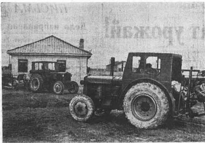
В Кореянской Народно-Демократической Республике в разгаре весенние полевые работы. Новую весну крестьяне КНДР встретили лучше, чем в предыдущие годы. Более половины всех крестьянских дворов вошли в производственные сельскохозяйственные кооперативы. Значительную помощь крестьянам оказали машинно-прокатные станции. Выросла механизация сельскохозяйственных работ. По сравнению с началом 1955 года число тракторов в КНДР увеличилось к настоящему времени почти в 4 раза. В этом году площадь пахоты, производимой тракторами, возрастает по сравнению с прошлым годом более чем в 2 раза.