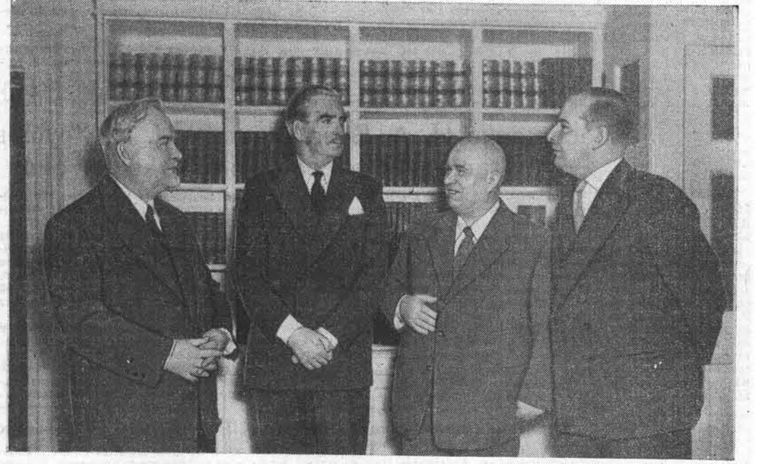
Пребывание в Англии Председателя Совета Министров СССР Н. А. Булганина и Члена Президиума Верховного Совета СССР Н. С. Хрущева. Н. А. Булганин и Н. С. Хрущев резиденции на Даунинг стрит, 10. На снимке (слева направо): Н. А. Булганин, А. Иден, Н. С. Хрущев, министр иностранных дел Селвин Ллойд.