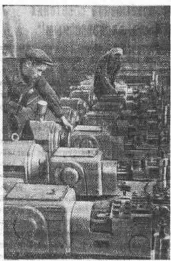
Славгородский завод имени «8 лет Октября» изготавливает для стран народной демократии трехлучевые горизонтальные насосы высокого давления для гидравлических прессов. На снимке: бригадир маллор Ф. П. Промолвенко за подготовкой насоса и отправки.