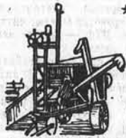
Больше узлов в деталях для зерновых комбайнов