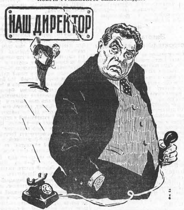
Сценарий — Г. Дорина. Режиссер — Жан Джорджеску. Фильм дублирован на киностудии им. М. Горького. Производство киностудии «Вухарест».