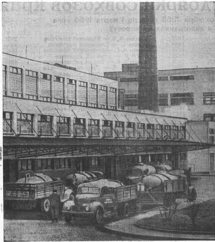
Чехословацкая Республика. К лучшим предприятиям молочной промышленности страны принадлежат новые молочный комбинат в Градец-Краловской области. В 1955 году комбинат переработал 2 миллиона литров молока сверх плана. Комбинат изготавливает сухое молоко, специальное молоко для грудных детей, масло, творог, сгущенку сыворотку. В этом году расширится ассортимент выпускаемой продукции: начнется выработка сухой сметаны и молочного сахара для фармацевтической промышленности. На снимке: молочный комбинат.