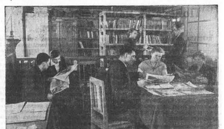
За короткий срок на усадьбе пединного Егорьевского совхоза вырос благоустроенный поселок. Большой популярностью среди новоселов пользуется библиотека, в которой насчитывается более трех тысяч книг. Их прислали комсомольцы Москвы, Краснодарского края и Кемеровской области. На снимке: в библиотеке Егорьевского зерносовхоза.

Корреспонденция на эту тему была опубликована в газете 1 февраля 1956 года. Секретарь Косихинского района КПСС Т. Приходько сообщил редакции, что корреспонденция опубликована в бюро райкома КПСС. Колхозники зоны Локтевского МТС ознакомились с содержанием кормов в фермах, выделены концентраты. В колхозе «Красный город» проведены переборы пралинения. В новом составе оно работает значительно лучше, серьезно занимается вопросами зимовки скота.