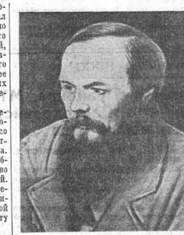
Понять Достоевского можно лишь в противоречиях его жизни и творчества, а корни этих противоречий уходят в противоречия современной ему общественной жизни.

В автобиографической сказке «Приключения с Крамоульщиконым» Шедриг писал о русском литераторе, который горячо любил свою родину и хорошо знал ее. Это знание «было живым источником болей, которые, непрерывно возобновляясь, сделались, наконец, главным содержанием его жизни».