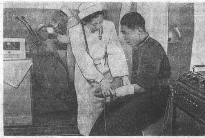
В Монгольской Народной Республике растут ряды народной интеллигенции. Тысячи детей рабочих и аратов стали специалистами с высшим образованием.

«Дейли экспресс» в редакционной статье заявляет, что Англия следует «вместо того, чтобы высрывать миллионы в Германии» отозвать свои войска из ГФР.