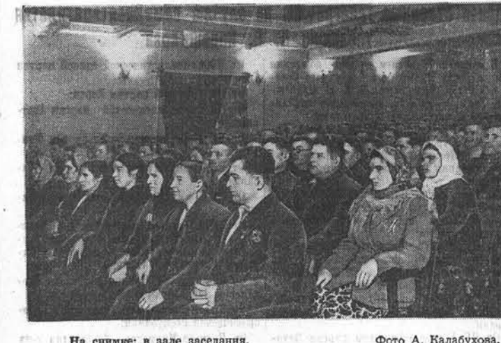
На снимке: в зале заседания.

Заверяю участников совещания — свое обязательство выполняю!