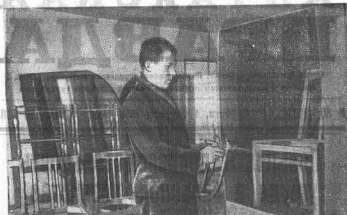
В барнаульской промартели «Алтайский мебельщик» широко применяется покрытие мебели галогитовым лаком. Сейчас здесь освоены новые методы покрытия — опрыскивание из пульверизатора в специальных кабинках.