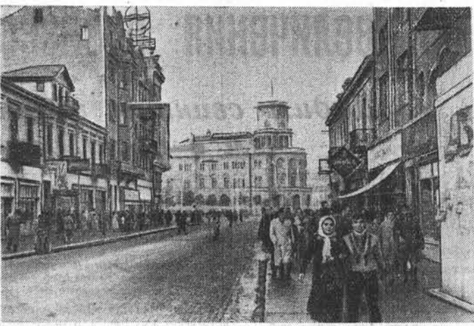
В Федеративной Народной Республике Югославии. На снимке: в городе Скопье.

То обстоятельство, что королевские лютанские войска предпринимают нападения во многих пунктах, заявляет Вьетнамское информационное агентство, показывает, что они активно готовятся к крупному наступлению на Фонг-Сали и Сам-Неа — зоны перегруппировки частей Патет-Лао.