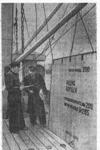
Одесса. Недавно из Рангуна прибыл крупнейший индийский теплоход «Ставрополь», который доставил из Бирмы чай, кофе и другие товары. В Одесском порту судно приняло в свои трюмы для дружественной Индии партию самодельных комбайнов, гусеничные тракторы, автогрейдеры, сляки, передвижные механические мастерские.

И. А. Каиров согласился с критическими замечаниями, высказанными на сессии депутатами в адрес Министерства просвещения РСФСР.