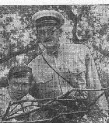
Кадр из фильма.

Зритель хорошо видит успехи деятельности Антона Семеновича и его товарищей по работе, как новаторов в педагогической науке. Верно подмечено также и то, что многим в своих достижениях Макаренко обязан личному обаянию, умению подолить