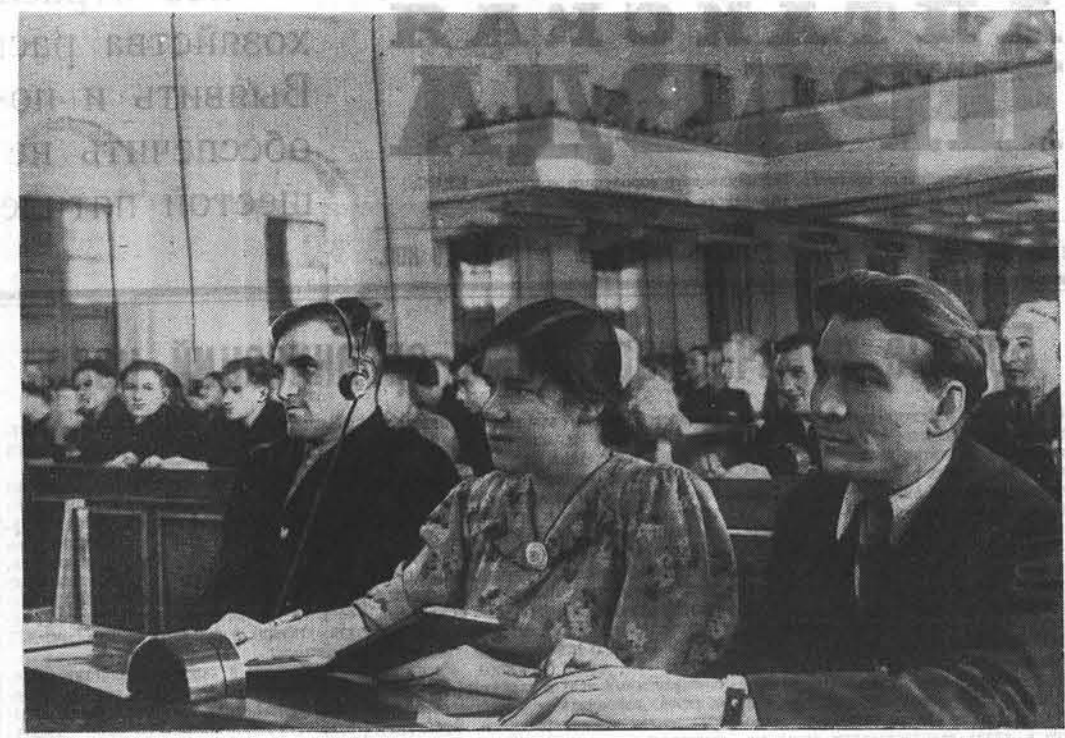
Москва. Совещание в Кремле комсомольцев и молодежи, отличившихся на освоении целинных и залежных земель.