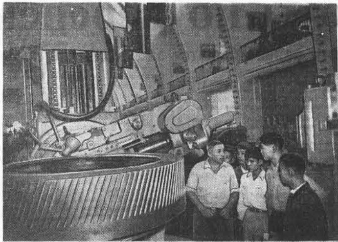
Китайская Народная Республика. В Кантоне при Выставке экономических и культурных достижений Советского Союза организованы курсы по изучению передового советского опыта...