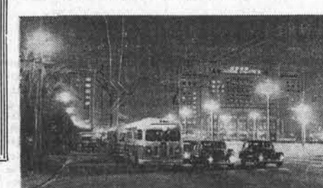
Москва. Манежная площадь вечером.

«Новая строительная техника». Они предназначены для демонстрации в крупнейших промышленных центрах страны. Фотопленки, схемы, таблицы этих выставочных знаменитых высокопроизводительных строительных машин, механизмов и инструментов, с индустриальными методами жилищного, промышленного и сельскохозяйственного строительства, применением сборных железобетонных конструкций, организацией труда на стройках. В ближайшие дни передвижные выставки будут направлены в Свердловск, Челябинск, Магнитогорск, Челябинск, Нижний Тагил, Сталино, Запорожье и другие города страны.