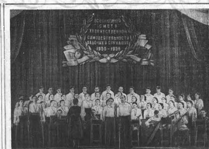
Два дня продолжается красной смотра художественной самодеятельности рабочих и служащих. Многие коллективы показали высокое мастерство. Обширной программой выступили участники художественной самодеятельности клуба Барнаульского меланжевого комбината.