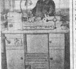
В станкостроительном цехе 3-го Московского часового завода, производящего станки для предприятий часовой промышленности, освоено производство тонкореволюльных станков марки Т-93А, предназначенных для обработки деталей из прутка с максимальным диаметром 14 миллиметров.