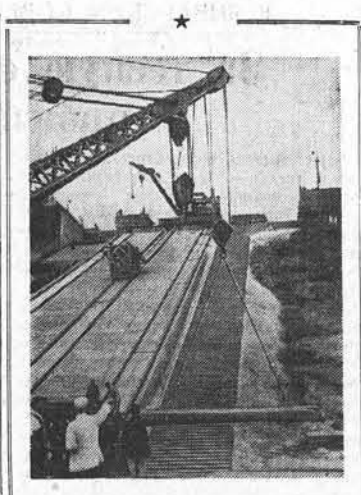
Китайская Народная Республика. Чунцин стал современным промышленным городом Юго-Западного Китая. Здесь имеются крупные предприятия тяжелой индустрии, машиностроительные заводы, текстильные фабрики.