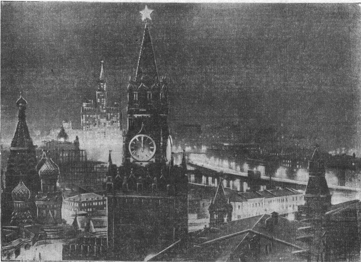
Москва в новогоднюю ночь.